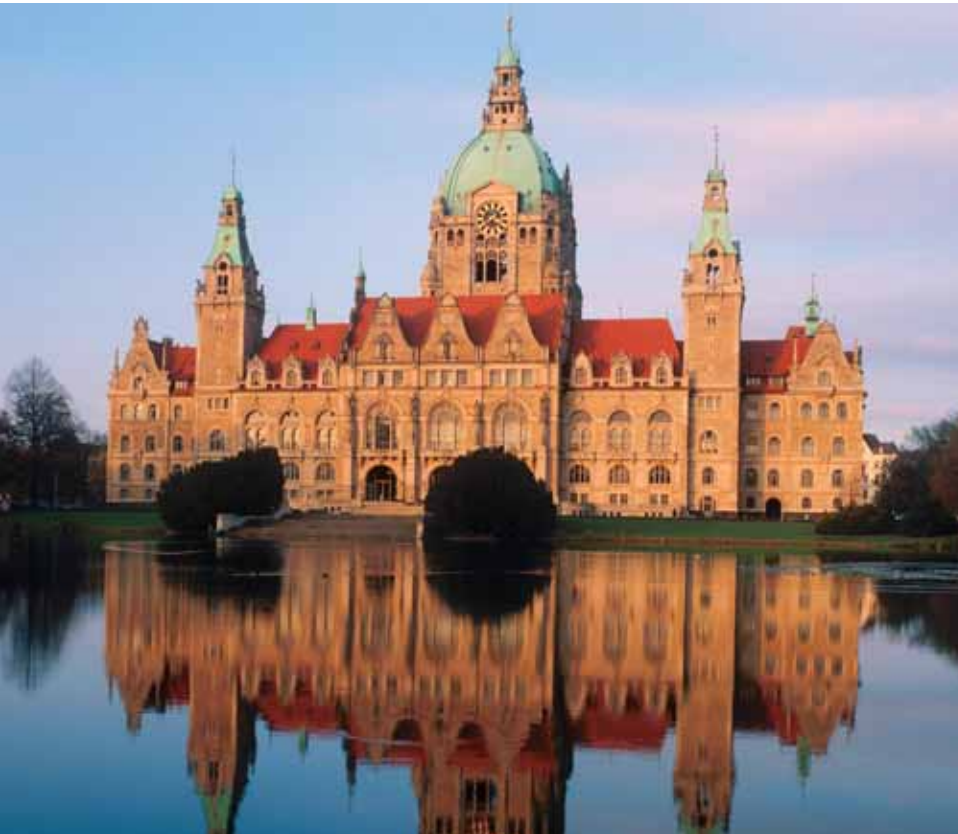
Una arquitectura divina: el palacio municipal de Hanóver.