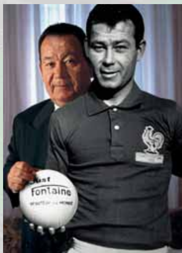
De izq. a der.: el sudafricano Pierre Issa, del croata Davor Suker y el francés Just Fontaine por duplicado – ayer y hoy.