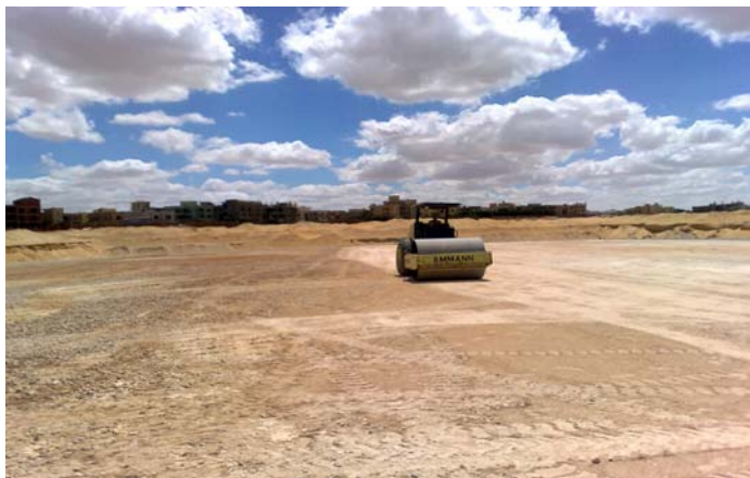
Centro de entrenamiento en Guiza

Más información sobre Ganar en Africa con Africa: http://es.fifa.com/mm/goalproject/WinAF_S.pdf