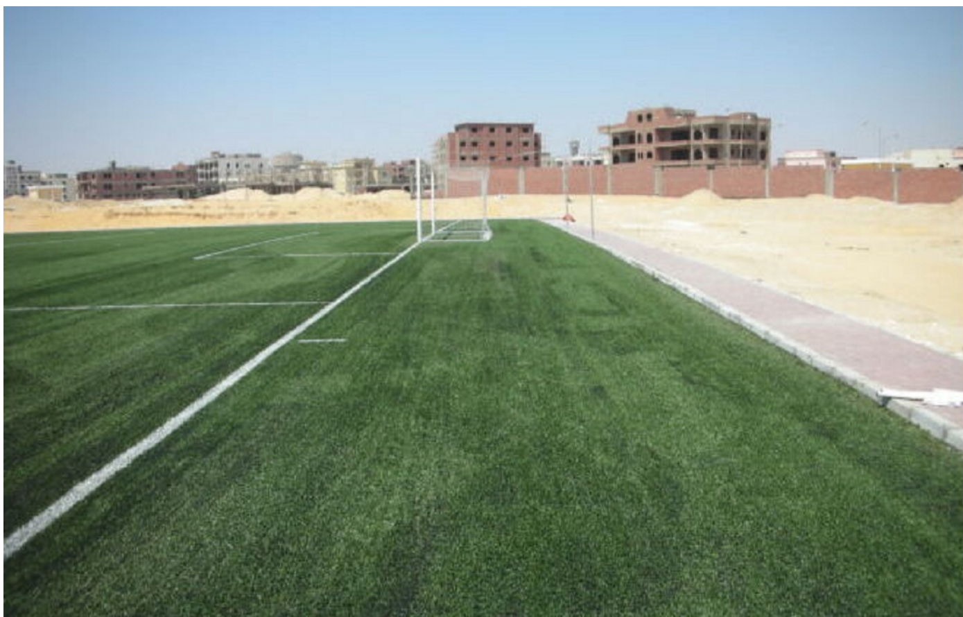
La nueva cancha de césped artificial está instalada y preparado para usar