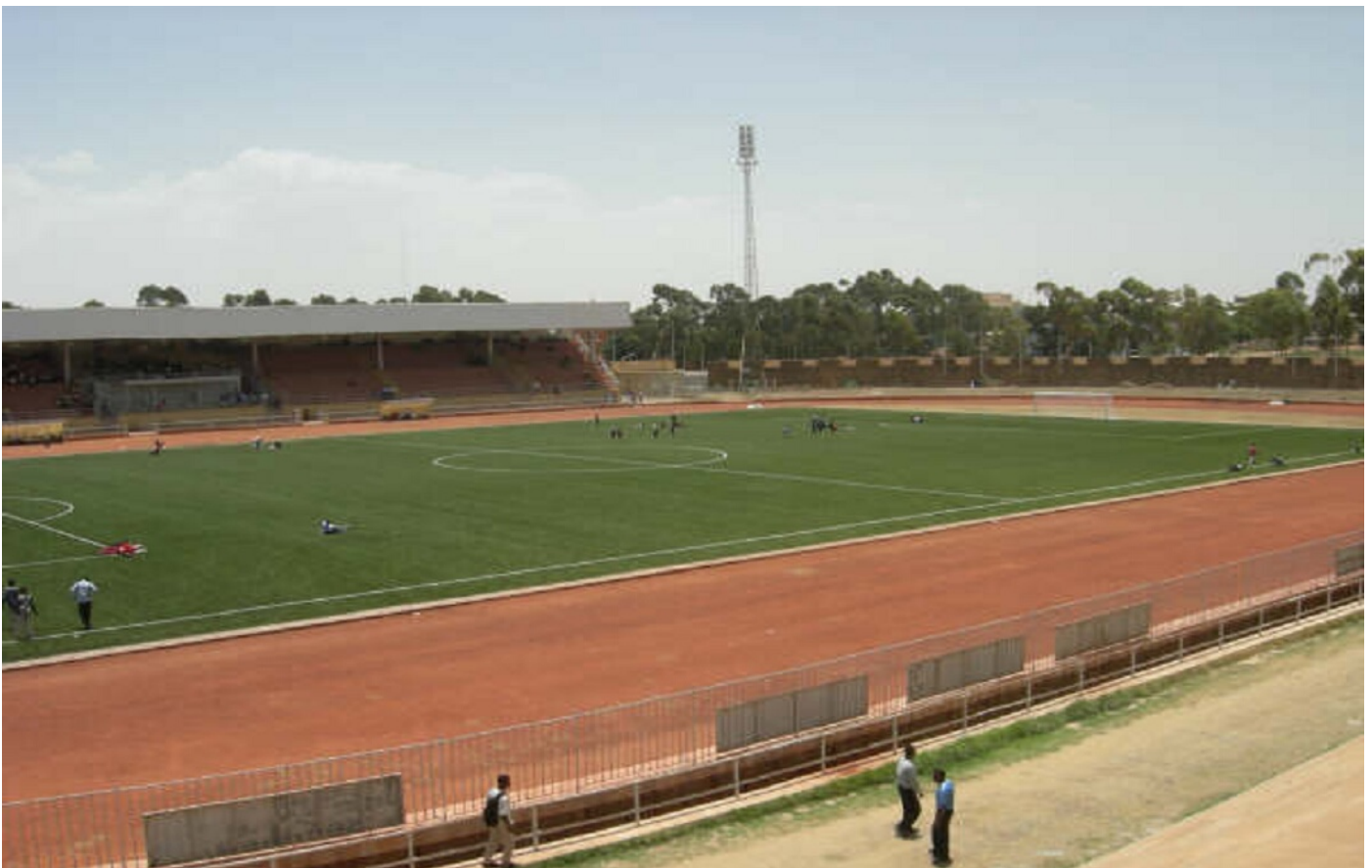
El Estadio Asmara poco antes de ser reinaugurado