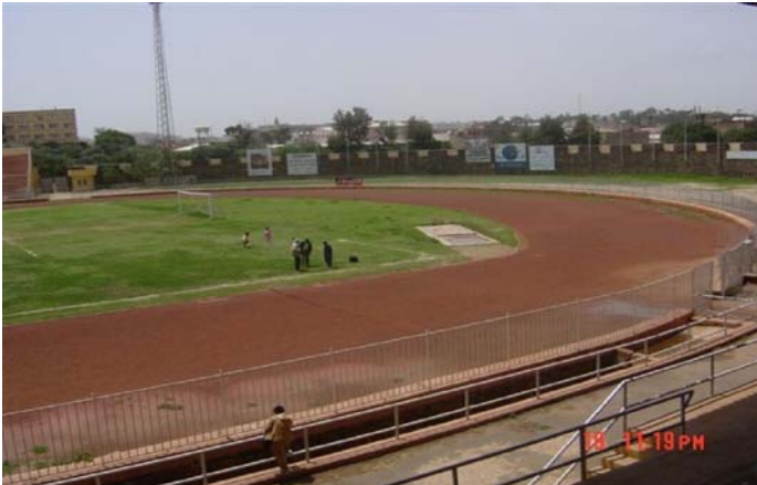
El Estadio Asmara antes de la instalación de la cancha de césped de fútbol.

Más información sobre Ganar en Africa con Africa: http://es.fifa.com/mm/goalproject/WinAF_S.pdf