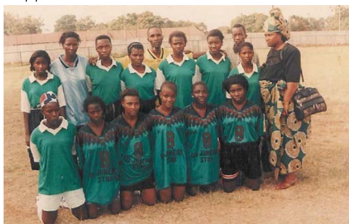
Un equipo de un club de Guinea