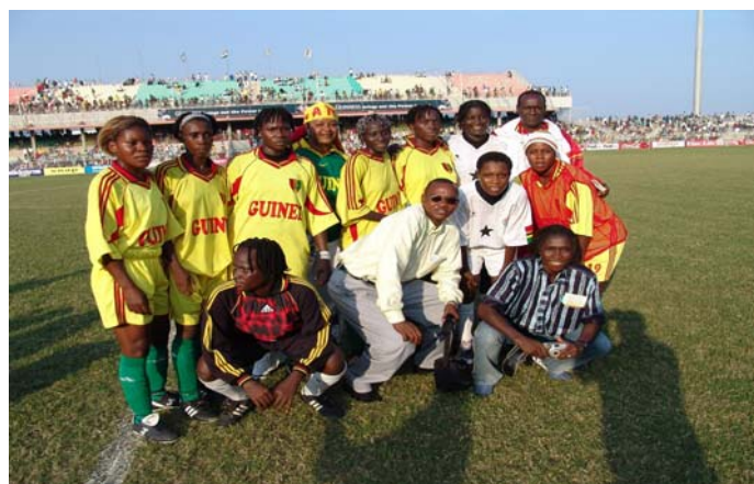
El equipo nacional femenino

Quando el Presidente de la FIFA declaró en 1995 que "El futuro es femenino", no era simplemente un lema propagandístico, ya que encerraba la firme convicción del gran potencial que existe en el fútbol femenino. Desde aquel día, la FIFA apoya los esfuerzos de las asociaciones por brindar a las mujeres las mismas posibilidades de desarrollo que a sus colegas masculinos. Desde la creación del Programa de Asistencia Financiera de la FIFA (FAP) en 1998, se conmina a las asociaciones y a las confederaciones a invertir cuatro por ciento desde 2004 y diez por ciento desde 2005 de los fondos recibidos. Este programa se refuerza mediante una promoción del fútbol con financiación directa, así como con la organización de torneos y simposios. Con sus programas de desarrollo, la FIFA participa activamente en la formación de administradores, entrenadores, árbitros y especialistas en medicina deportiva.