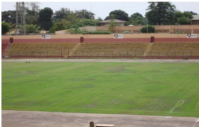
Estadio Anexo 28 de septiembre, Conakry – capacidad: 21,000 espectadores

Más información sobre Ganar en Africa con Africa: http://es.fifa.com/mm/goalproject/WinAF_S.pdf