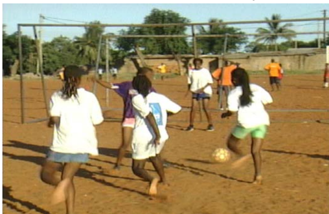
Sesión de entrenamiento en una superficie árida de países secos