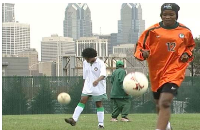
Terreno de entrenamiento en el techo de un edificio en Argel

Quando el Presidente de la FIFA declaró en 1995 que "El futuro es femenino", no era simplemente un lema propagandístico, ya que encerraba la firme convicción del gran potencial que existe en el fútbol femenino. Desde aquel día, la FIFA apoya los esfuerzos de las asociaciones por brindar a las mujeres las mismas posibilidades de desarrollo que a sus colegas masculinos. Desde la creación del Programa de Asistencia Financiera de la FIFA (FAP) en 1998, se conmina a las asociaciones y a las confederaciones a invertir cuatro por ciento desde 2004 y diez por ciento desde 2005 de los fondos recibidos. Este programa se refuerza mediante una promoción del fútbol con financiación directa, así como con la organización de torneos y simposios. Con sus programas de desarrollo, la FIFA participa activamente en la formación de administradores, entrenadores, árbitros y especialistas en medicina deportiva.