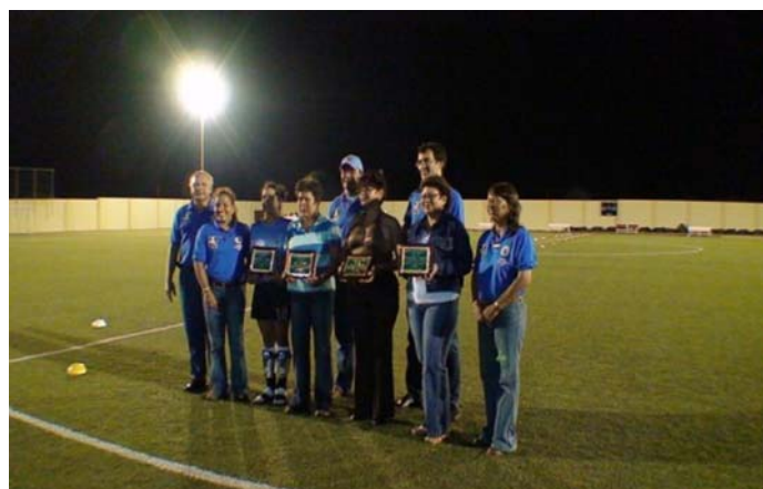
La Comisión del Fútbol Femenino de la AF de Aruba

Quando el Presidente de la FIFA declaró en 1995 que "El futuro es femenino", no era simplemente un lema propagandístico, ya que encerraba la firme convicción del gran potencial que existe en el fútbol femenino. Desde aquel día, la FIFA apoya los esfuerzos de las asociaciones por brindar a las mujeres las mismas posibilidades de desarrollo que a sus colegas masculinos. Desde la creación del Programa de Asistencia Financiera de la FIFA (FAP) en 1998, se comina a las asociaciones y a las confederaciones a invertir cuatro por ciento desde 2004 y diez por ciento desde 2005 de los fondos recibidos. Este programa se refuerza mediante una promoción del fútbol con financiación directa, así como con la organización de torneos y simposios. Con sus programas de desarrollo, la FIFA participa activamente en la formación de administradores, entrenadores, árbitros y especialistas en medicina deportiva.