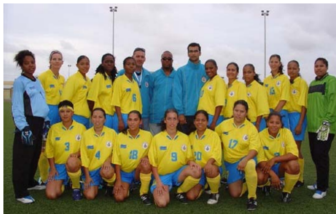
La selección nacional femenina 2006