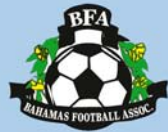
Emblema de la asociación