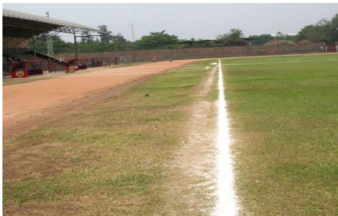
El Estadio Prince Louis Rwagasore antes de la renovación de la superficie de juego.

Más información sobre Ganar en Africa con Africa: http://es.fifa.com/mm/goalproject/WinAF_S.pdf