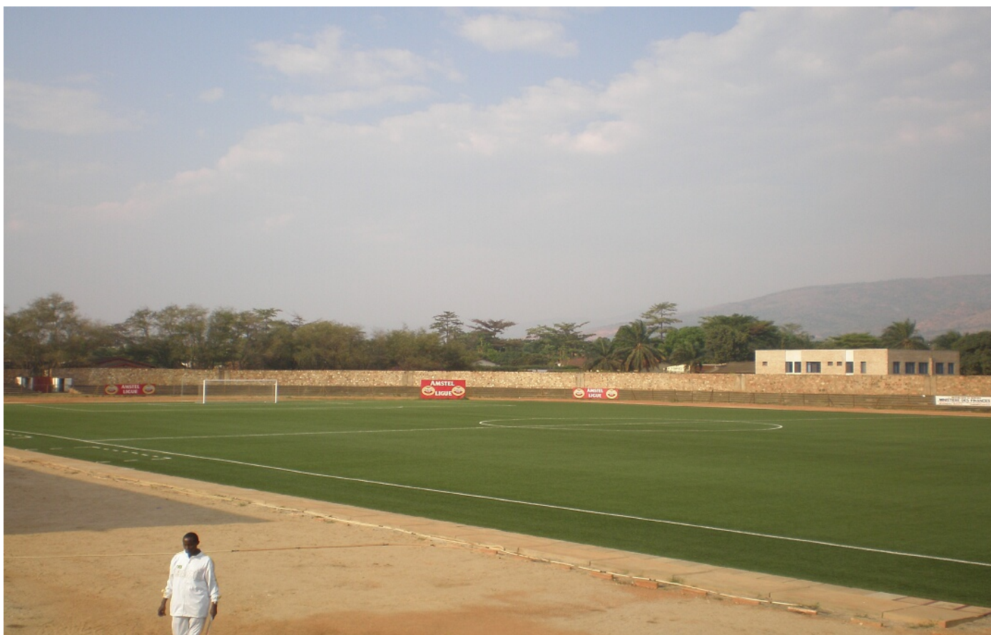
Sobre este nuevo césped de fútbol se celebró el Torneo Internacional Sub-17 de CECAFA en agosto de 2007, con ocho equipos participantes.