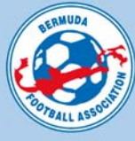
Emblema de la asociación