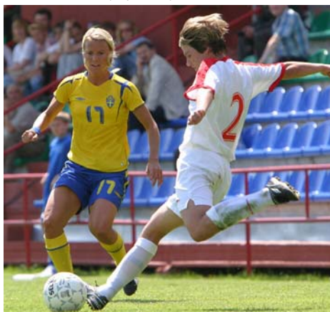
Partido internacional contra Suecia