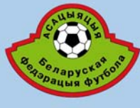
Emblema de la asociación