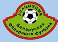
Emblema de la asociación