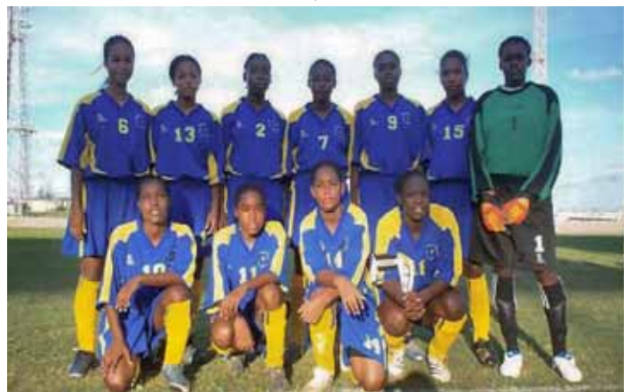
La selección nacional femenina de Barbados