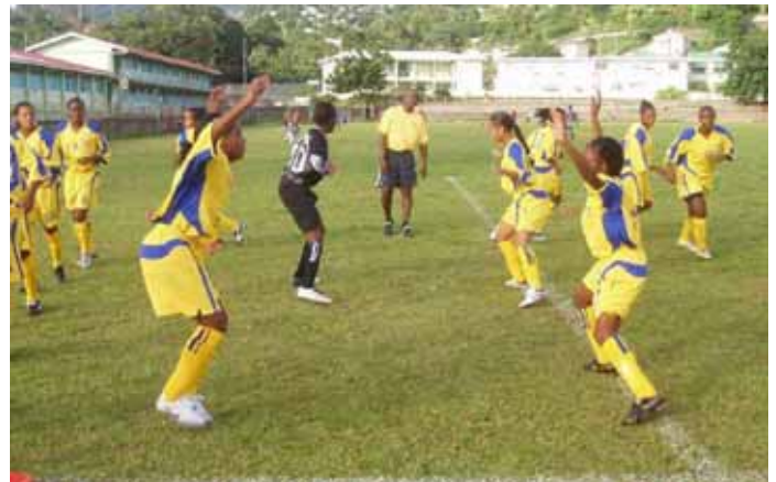
¿Entrenamiento de fútbol o lección de jazz?

Cuando el Presidente de la FIFA declaró en 1995 que "El futuro es femenino", no era simplemente un lema propagandístico, ya que encerraba la firme convicción del gran potencial que existe en el fútbol femenino. Desde aquel día, la FIFA apoya los esfuerzos de las asociaciones por brindar a las mujeres las mismas posibilidades de desarrollo que a sus colegas masculinos. Desde la creación del Programa de Asistencia Financiera de la FIFA (FAP) en 1998, se comina a las asociaciones y a las confederaciones a invertir cuatro por ciento desde 2004 y diez por ciento desde 2005 de los fondos recibidos. Este programa se refuerza mediante una promoción del fútbol con financiación directa, así como con la organización de torneos y simposios. Con sus programas de desarrollo, la FIFA participa activamente en la formación de administradores, entrenadores, árbitros y especialistas en medicina deportiva.