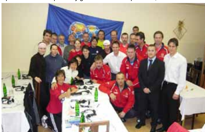
Seminario de la FIFA sobre el fútbol femenino, 2008