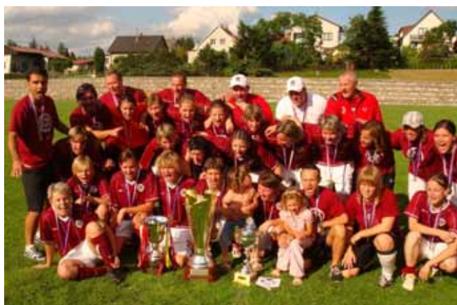
Sparta Praha - campeonas y ganadoras de la copa checa, 2008

Cuando el Presidente de la FIFA declaró en 1995 que "El futuro es femenino", no era simplemente un lema propagandístico, ya que encerraba la firme convicción del gran potencial que existe en el fútbol femenino. Desde aquel día, la FIFA apoya los esfuerzos de las asociaciones por brindar a las mujeres las mismas posibilidades de desarrollo que a sus colegas masculinos. Desde la creación del Programa de Asistencia Financiera de la FIFA (FAP) en 1998, se conmina a las asociaciones y a las confederaciones a invertir cuatro por ciento desde 2004 y diez por ciento desde 2005 de los fondos recibidos. Este programa se refuerza mediante una promoción del fútbol con financiación directa, así como con la organización de torneos y simposios. Con sus programas de desarrollo, la FIFA participa activamente en la formación de administradores, entrenadores, árbitros y especialistas en medicina deportiva.