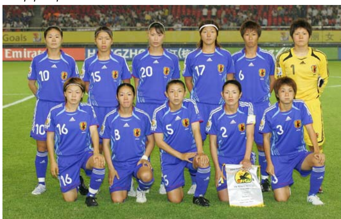
El equipo nacional femenino japonés "A"