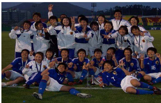
El equipo representativo femenino sub-16

Cuando el Presidente de la FIFA declaró en 1995 que "El futuro es femenino", no era simplemente un lema propagandístico, ya que encerraba la firme convicción del gran potencial que existe en el fútbol femenino. Desde aquel día, la FIFA apoya los esfuerzos de las asociaciones por brindar a las mujeres las mismas posibilidades de desarrollo que a sus colegas masculinos. Desde la creación del Programa de Asistencia Financiera de la FIFA (FAP) en 1998, se comina a las asociaciones y a las confederaciones a invertir cuatro por ciento desde 2004 y diez por ciento desde 2005 de los fondos recibidos. Este programa se refuerza mediante una promoción del fútbol con financiación directa, así como con la organización de torneos y simposios. Con sus programas de desarrollo, la FIFA participa activamente en la formación de administradores, entrenadores, árbitros y especialistas en medicina deportiva.