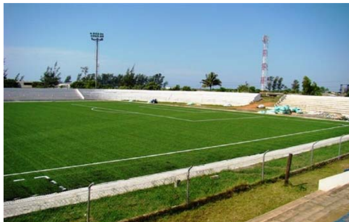
El Estadio de Macheva está listo para partidos internacionales.