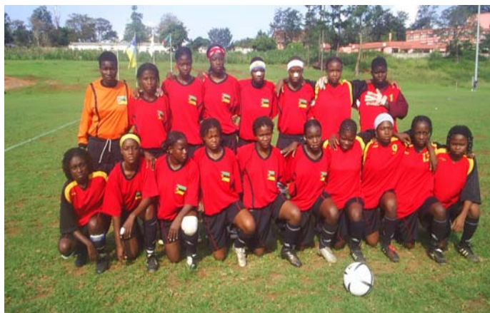
El equipo femenino sub-20 de Mozambique

Quando el Presidente de la FIFA declaró en 1995 que "El futuro es femenino", no era simplemente un lema propagandístico, ya que encerraba la firme convicción del gran potencial que existe en el fútbol femenino. Desde aquel día, la FIFA apoya los esfuerzos de las asociaciones por brindar a las mujeres las mismas posibilidades de desarrollo que a sus colegas masculinos. Desde la creación del Programa de Asistencia Financiera de la FIFA (FAP) en 1998, se comina a las asociaciones y a las confederaciones a invertir cuatro por ciento desde 2004 y diez por ciento desde 2005 de los fondos recibidos. Este programa se refuerza mediante una promoción del fútbol con financiación directa, así como con la organización de torneos y simposios. Con sus programas de desarrollo, la FIFA participa activamente en la formación de administradores, entrenadores, árbitros y especialistas en medicina deportiva.