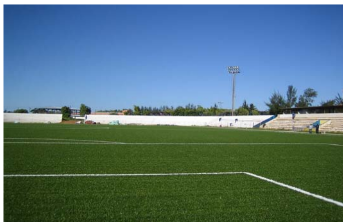
Los costos totales los cubrieron la FIFA y el Gobierno de Mozambique por igual.