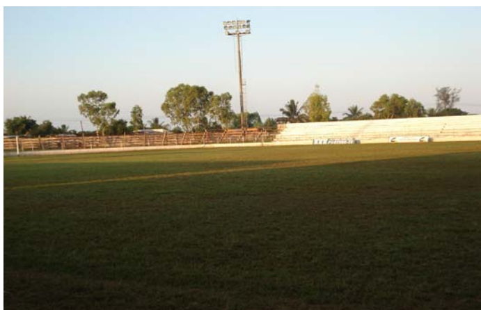
El otro terreno de fútbol: Clube de Desportos Costa do Sol.