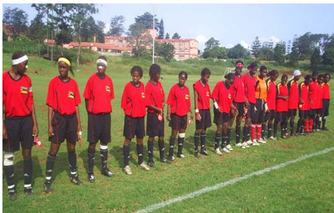
El equipo sub-20 alineándose antes del saque de salida contra Rusia