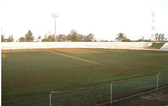
Estadio da Machava – una de las dos sedes en las que se instalaron canchas de césped para fútbol con el sello de la FIFA.

Más información sobre Ganar en Africa con Africa: http://es.fifa.com/mm/goalproject/WinAF_S.pdf