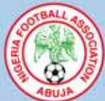
Emblema de la asociación