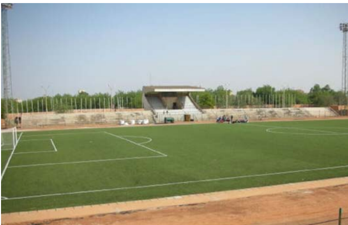
La nueva cancha de césped de fútbol poco antes de su inauguración.