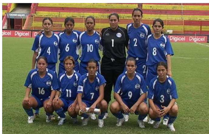
El equipo nacional femenino "A"