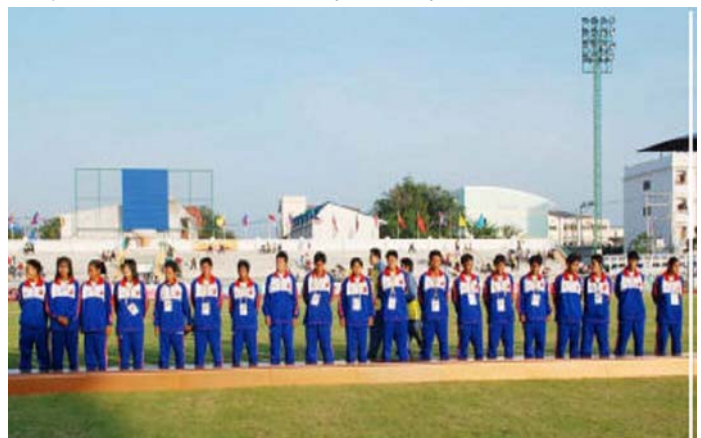
Medallas de bronce para las futbolistas de Tailandia