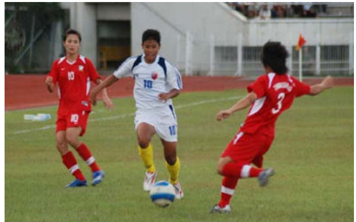
Campeonato femenino ASEAN en Myanmar: Myanmar contra Tailandia

Quando el Presidente de la FIFA declaró en 1995 que "El futuro es femenino", no era simplemente un lema propagandístico, ya que encerraba la firme convicción del gran potencial que existe en el fútbol femenino. Desde aquel día, la FIFA apoya los esfuerzos de las asociaciones por brindar a las mujeres las mismas posibilidades de desarrollo que a sus colegas masculinos. Desde la creación del Programa de Asistencia Financiera de la FIFA (FAP) en 1998, se conmina a las asociaciones y a las confederaciones a invertir cuatro por ciento desde 2004 y diez por ciento desde 2005 de los fondos recibidos. Este programa se refuerza mediante una promoción del fútbol con financiación directa, así como con la organización de torneos y simposios. Con sus programas de desarrollo, la FIFA participa activamente en la formación de administradores, entrenadores, árbitros y especialistas en medicina deportiva.