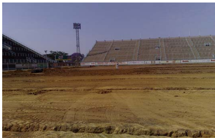
La cancha requirió mucho trabajo.