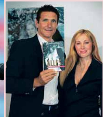
El mejor futbolista actual de Camerún: Samuel Eto'o – Los esposos Bodo y Bianca Illgner.

da. Y después jugaron por la número uno. In memoriam.