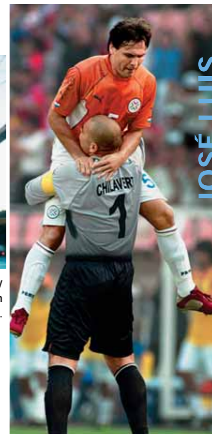
JOSÉ LUIS CHILAVERT

Pero hay más actividades en la agenda de Chilavert, aunque elija no comentarlas. Tiene una clínica oftalmológica en Asunción, donde asiste a los más necesitados, familias que no pueden pagar curas adecuadas a sus hijos, y es el sostén de la fundación “Pa’i Pukú” (padre largo, en guaraní) que da albergue y educación a 600 niños de la región del Chaco. En Montevideo, Uruguay, además de su paso por Peñarol, quedó como padrino de dos centros de discapacitados motri-