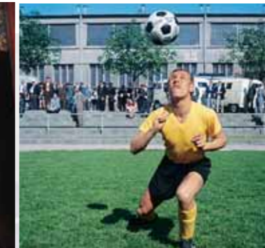
El equipo campeón mundial de Uruguay 1950 – El alemán Sigfried Held.