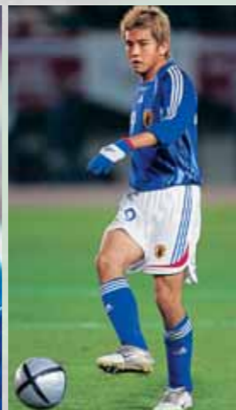
El brasileño Rivelino en la CM 1970, Paolo Rossi, goleador italiano, y el medio-campista japonés Junichi Inamoto (de izq. a derecha).