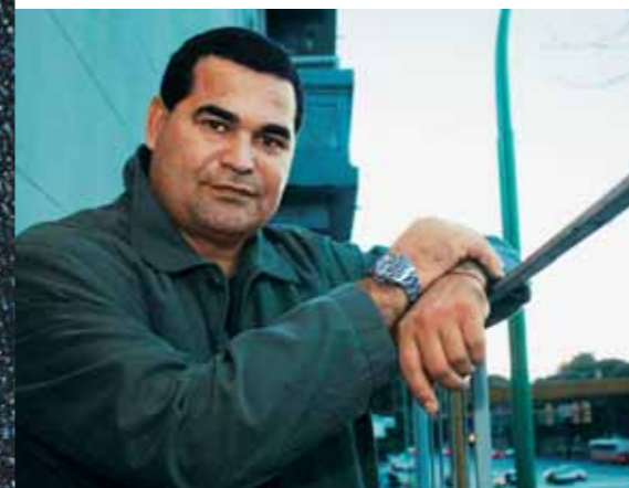
Pasado, como portero en la CM 2002, y presente, como hombre de negocios en Buenos Aires: José Luis Chilavert.

► bilidades que yo tuve con el fútbol. Pero otra vez seré el malo de la historia, tendré que seleccionar a los mejores. Además, fuera de esto, estamos llevando yerba mate a Japón”, dice Chilavert, quien durante la Copa Mundial 2006 en Alemania será comentarista de una cadena deportiva en español.